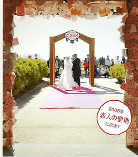
2008年 恋人の聖地 に認定!

帯広市愛国町基線39-40 開館時間/9:00～17:00 ●3月～11月/無休 ●12月～2月/日曜のみ開館 ●見学無料 ●駐車場/20台 ◎売店/小森商店(十勝屋売店) ※不定休 営業時間/8:00～17:00 TEL/0155-64-4121 ※営業時間等、変更する場合がございます。事前にお問合わせ下さい。