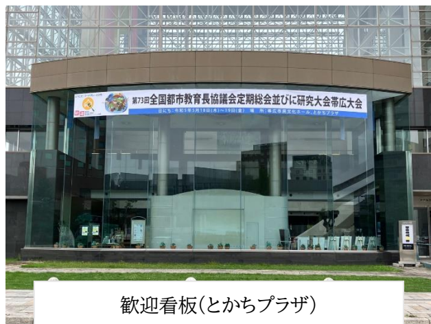
歓迎看板(とちプラザ)