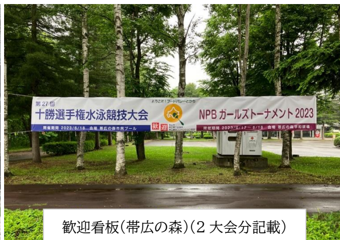
歓迎看板(帯広の森)(2大会分記載)